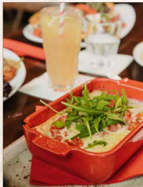
Dieses Gericht arbeitet 24/7 im Schichtdienst.

Lasagne al forno original italienische Nudeln mit marinierten Tomatenwürfeln und herzhafter Bolognese-Sauce aus Rinderhackfleisch, gratiniert mit Käse € 12,95